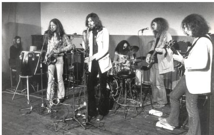
Subject Esq. 1973 kurz vor der Umbenennung in Sahara

Vor Konzertbeginn um 19:00 Uhr im Foyer ein weiteres Highlight: Der 45-minütige Kurzfilm „ Ein Dia-Abend von der Revolution “ von Franz Wanner gibt Einblicke in die 68-er Bewegung an der Münchner Kunstakademie. Hierfür wurden in Workshops von Studenten der Kunstakademie historische Hintergründe der Studentenrevolte recherchiert, Zeitzeugen ausfindig gemacht und Interviews geführt. In Kombination mit historischem Film- und Fotomaterial ein höchst interessantes Dokument jener Zeit.